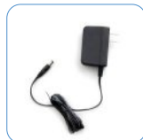
Adaptador de energía 12 V/1 A