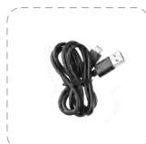
Cable de tipo-C