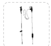
Auricular con tubo acústico transparente