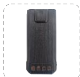
Batería de Li-ion 2200 mAh