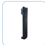
Clip para el cinturón