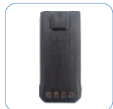
Batería de Li-ion 1500 mAh

ACCESORIOS ESTÁNDAR: ACCESORIOS OPCIONALES: