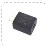
Adaptador de energía (USB)