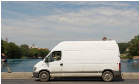
Servicio de entregas