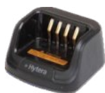
Cargador rápido MCU general (para baterías de iones de litio/níquel-hidruro metálico) CH10A07