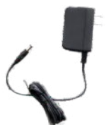
Adaptador para alimentación conmutada